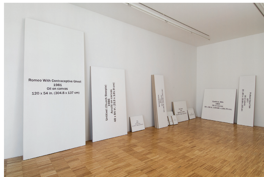
Mario García Torres, Esta pintura está perdida / Esta pintura ha sido encontrada , 2006 - present. Acrylic on canvas. La Colección Jumex

Without settling on a particular direction through his practice, a certain loss of optimism and the nostalgia it provokes set against inevitable change are active and emotive elements in García Torres's projects. If one were to attempt to place his work in a lineage—a misdirection, perhaps, yet helpful one—his practice casts back to that of Bas Jan Ader and On Kawara among others, artists who took pared down approaches and aesthetics yet retained an intimacy rather than moving wholeheartedly in the cool conceptualism. More recently, García Torres has made specific references to romanticism. A series of paintings from this year saw him acting as plein-air painter, each a sketchy drawing of a landscape, yet cast on fluorescent paint backgrounds and stamped over with the artist's seal rather than signed, as if trying to find a mediation between the present and the art of the past. Indeed, in Solo this is extended. While there are few positive sides to the pandemic, it does provide artists and us all with a moment to pause and to question what we do. In this interstice, García Torres's project takes the opportunity to return to what many artists began with, being alone in a studio simply making and thinking. The tension between this imagination of an artist's work, and the reality of administration, conversation and distraction at work, particularly today with the proliferation of means to communicate online is equally on display.