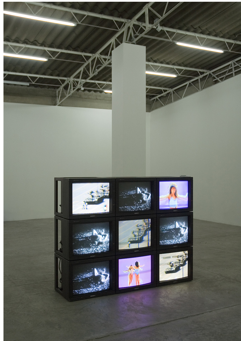
Mario García Torres, All that Color is Making Me Blind (Notas sobre el comienzo y el final del videoarte) [Todo ese color me está dejando ciego (Notas sobre el comienzo y el final del videoarte)], (2008). La Colección Jumex

Xoco: The Kid Who Loved Being Bored (cont.) [Xoco: El niño que amaba estar aburrido] (cont.), 2013, es una animación sencilla del personaje que se repite durante 2 minutos y 15 segundos. Sin embargo, esa misma animación se mueve entre diferentes fondos, proyectados en varios lienzos. Si bien tanto el personaje como su limitado repertorio de acciones permanecen constantes, una lectura sugiere que el mundo que lo rodea es inestable. Series anteriores incluyen pinturas con frases como “Esta pintura está perdida” y “Esta pintura ha sido encontrada” (2006 - en curso), mientras que otras obras han utilizado el poco confiable servicio postal para determinar cuáles tienen valor: las que llegan son obras, que se muestran junto a la “evidencia” de sus recibos, mientras que otras pueden o no seguir circulando en el correo.